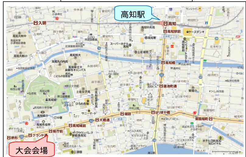
大会会場および高知駅周辺地図